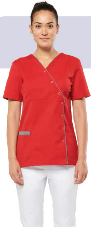
Blouses en polycoton résistant