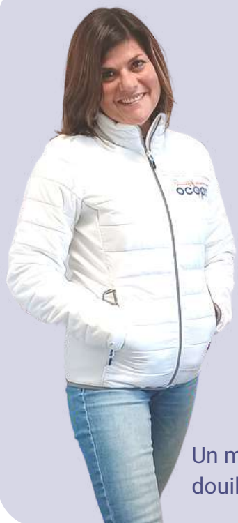
Un modèle bien douillet

Frileux, frimeurs, franchouillards ou futés, la doudoune s'adapte à tout et à tous !