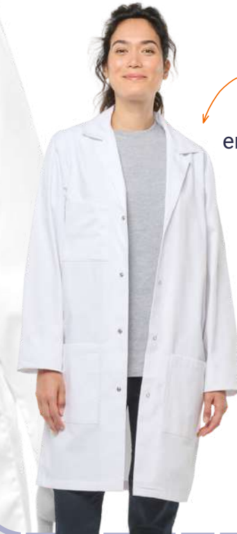
Blouse en tissu sergé 100% coton